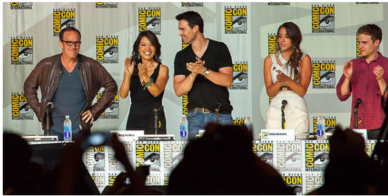
Die Hauptbesetzung bei der Comic-Con im Juli 2013