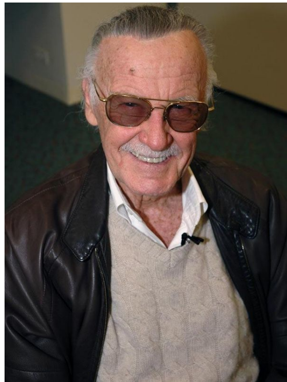
Stan Lee (2007)

In späteren Jahren wurde Lee eine Galionsfigur für Marvel Comics. Er trat auf Comic-Conventions im ganzen Land auf, hielt Lesungen und nahm an Podiumsdiskussionen teil. 1981 zog er nach Kalifornien, um Marvels TV- und Filmprojekte zu fördern. Er war ausführender Produzent vieler Filme, die auf Marvel-Charakteren basierten, und hatte in vielen Filmen kurze Cameo- und Gastauftritte (siehe unten).