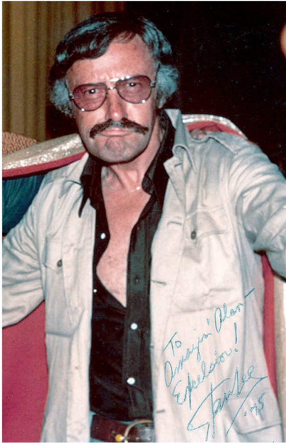
Stan Lee (1975)

Bill Everett kreierte Lee Daredevil und mit Steve Ditko Doctor Strange und Spider-Man . Diese Charaktere halfen das Superheldengenre neu zu erfinden. Lee gab seinen Charakteren Fehler und Probleme. Seine Helden hatten Wutausbrüche, waren melancholisch, eitel oder gierig. Sie kämpften miteinander, hatten Probleme die Miete zu bezahlen und manche hatten gesundheitliche Probleme. Lee schrieb Charaktere, mit denen sich der Leser identifizieren konnte, statt der unfehlbaren Idole, die Superhelden vorher gewesen waren.